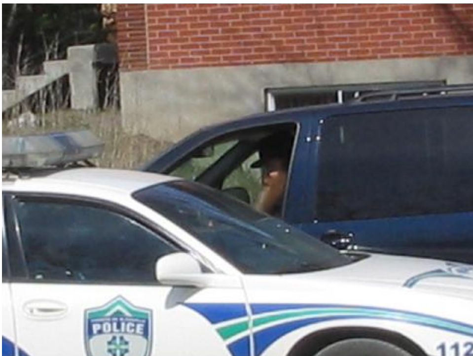
א בילד ווי איינער פון די ראשי הקהילה ניבן איבער מלשינות פאר די פאלשע

אלע אנ"ש האבן עס אויפגענומען מיט א שטארקער עקסטאז און פרייד, און אלע האבן כפה אחת מודה געווען אז אזא זאך פעלט גאר שטארק אויס.