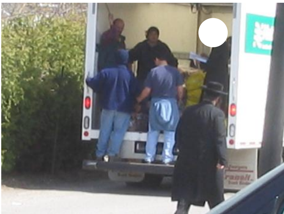
ביגעלייגט איז א בילד פון די קמחא דפסחא טראק וואס איז ארומגעפארן באלייכטן די אידישע שטובער, און ווי דער משב"ק זאל זיין געזונט קוקט זיך צו מיט א קענטיגער פרייד.

עס האבן דערין געטריי געארבייט ערנסטע אינגערלייט פון שטעטל, וואס האבן זיך איבערגעגעבן דערפאר בלב ובנפש, ווען עס איז ארומגעפארן דער טראק אויסצוטיילן די