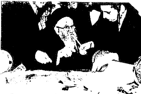
הגה"צ מוהר"ר נפתלי צבי הברשטאם שליט"א בן כ"ק אדמו"ר מבאבוב שליט"א