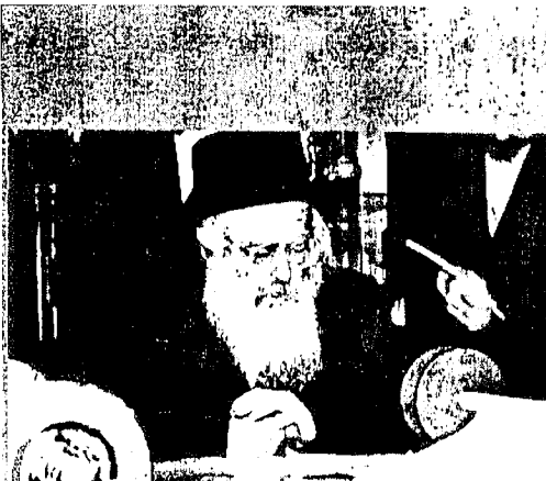
כ"ק אדמו"ר ממונקאטש שליט"א