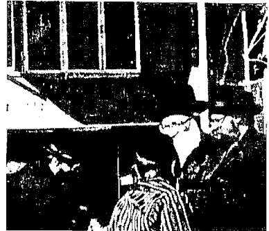
כ"ק אדמו"ר מראחמעסטריוקא שליט"א