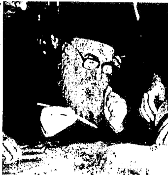
הגה"צ אבד"ק אודווארי שליט"א