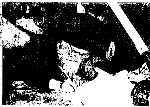
הגה"צ אבד"ק סערדאהעלי שליט"א