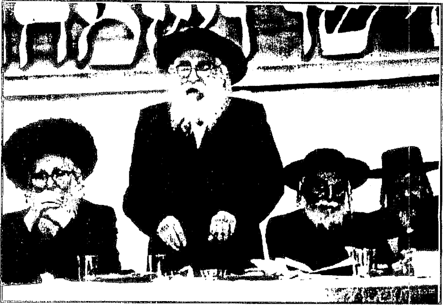
הגה"צ אבד"ק אודווארי שליט"א ביי זיין פייערדיגע דרשה