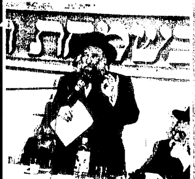
כ"ק אדמו"ר מטשערנאביל שליט"א, כ"ק אדמו"ר מחוסט שליט"א (נראים), לחניצ אבדי"ק גרויסווארדין שליט"א