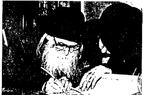
הגה"צ רבי פישל הערשקאוויטש שליט"א