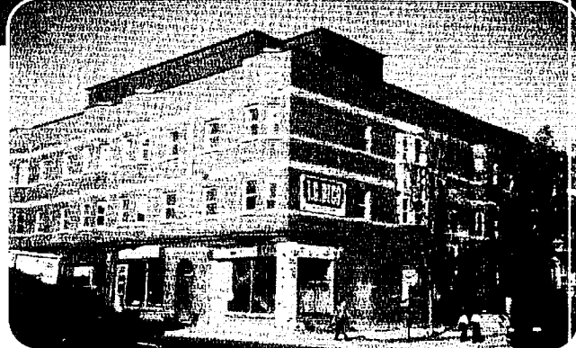
רוח הקודש אומרת כן ירבה וכן יפרוץ: די נייע געביידע, וואו וויזניצער קהילה גייט בויען א שפאגל נייע ביהמ"ד