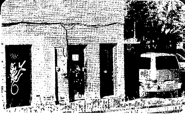
די צייטווייליגע געביידע וואס דינט אלס בית מקדש מעט פאר דער וויזניצער קהילה