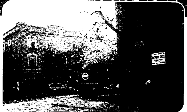
די מרשעת האט ארויסגעווארפן די וויזניצער קהילה פון דער ווייסער געביידע, קעגן דער סקוידער מיידל-שולע

לויט'ן מאנטרעאלן געזעץ, איז מעגליך אפצושלאגן א לאקאלן געזעץ דורך א רעפערענדום. פארזשעט האט זיך ארויפגעכאפט אויף דעם געזעץ, און אויפגעקליבן פעטיציעס דורכצופירן א רעפערענדום אויפ'ן לעגאליטעט פון וויזניצער ביהמ"ד. דער רעפערענדום וואלט געווען א גרויסע פראבלעם, ווייל ווייניג חסיד'ישע אידן וואוינען אין די ספעציפישע בלאקן וואו נאר יענע איינוואוינער קענען שטימען אויף דעם רעפערענדום. בס"ד איז דעמאלט געלונגען דורך אומערמידליכע שתדלנות צו ערלעדיגן אז דער רעפערענדום זאל נישט צושטאנד קומען.