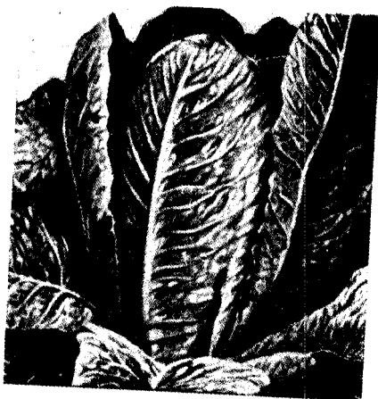
חזרת ENGLISH LETTUCE

ומצוה לחזור אחריו לצאת בו ידי חובת מרור בפסח כמבואר בש"ע או"ח סי' תע"ג סעיף ה', ובשו"ת חכם צבי סי' קי"ט, ועי' שו"ת חת"ם או"ח סי' קל"ב שכתב כי אמת נכון הדבר כי זהו המרור המובחר, והכי נהגו כל רבותי זצ"ל ואנו נוהגים אחריהם, אך רגיל אני לדרוש בשבת הגדול, מי שאין לו אנשים מיוחדים, מסוימים בעלי יראה הבודקים ומנקים אותו מרחש תולעים קטנים הנמצאים מאד מאד בימי הפסח, ואינם ניכרים לחלושי ראות, לא יקח החזרת, אף שהוא מצוה מן המובחר, ולא יכשל בלאו או בלאוין הרבה אפילו בספק משום קיום עשה דרבנן, דמרור בזמן הזה דרבנן, ויקח תמכא שקורין קריין וכו' עי"ש. ועי' דרכי תשובה סי' פ"ד סק"צד בשם כנסת הגדולה שכתב דבמקומו מצוי הרחש בחזרת, וצריך בדיקה יפה מפני שהתולעים דקים וכמראה החזרת עצמו, ומקודם היה מנהגו שלא לאכלו כי אם בבדיקה, ואחר כך משך ידו ממנו שלא לאכלו אפילו בבדיקה עי"ש, והכרתי ופלתי בסי' פ"ד ביו"ד סק"ט כתב דמיום עמדו על דעתו לא אכל סאלאט (חזרת) על סמך בדיקת נשים, וכן נכון לכל בעל תורה, כי רבה המכשלה, אמנם בערוך השלחן שם אות פ"ב כתב ומימינו לא שמענו אפילו על צדיקי וגאוני עולם שלא יסמכו על נשותיהם הכשרות בבדיקת תולעים וכן בנות ישראל העובדות בשכירות, אם הבעל הבית מכיר אותה, שהיא יראה את ד' ומדקדקת באיסורין יכול לסמוך עליה עי"ש.