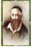
רבינו משה איסרליש ויע"א

לימוד שולחן ערוך אורח חיים לכל החודש - ח' עמודים ליום כל השנה "הלכות" בי"ל יוס"י חובטת לו שהוא "בן עולם הבא"!