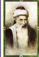
רבינו יוסף קארו זי"ע בעל מחבר ספר "שולחן ערוך" נפטר בעיר טריפולי בשנת ה'רמ"ב י"ג ניסן שנת ה'רמ"ב (שנת ה'רמ"ב לפ"ק) (שם אביו ר' ישראל ז"ל)