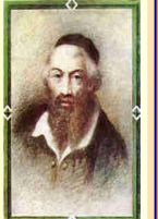
רבינו משה איסרליש זיע"א בעל מחבר ספר "דברי משה" נפטר בעיר קראקא י"ז י"ח אייר שנת ת"א שנת ה'ת"ק (שם אבן ר' אפרים ז"ל)