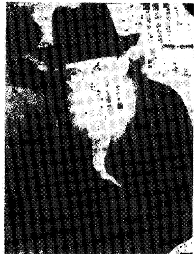
מרן החזון איש ז"ע

[סופר על ידי הגרייב שליטיא, מבאי ביתו של החזו"א]