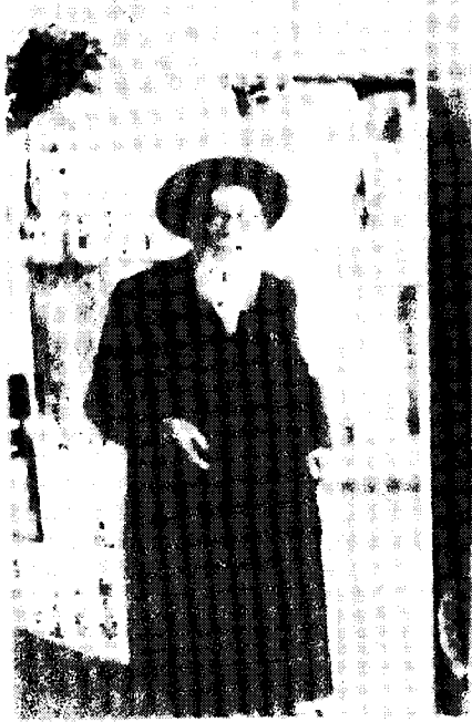
מרן הגרש"ז ז"ע

הערה: לכד ממה שהגרבים השקופות מכשילות את הרבים ברחוב, הן מכשילות גם בבית, שכן אפלו לבני ביתם אסור לומר דבר שבקדישה כנגד "ערוה בעששית".