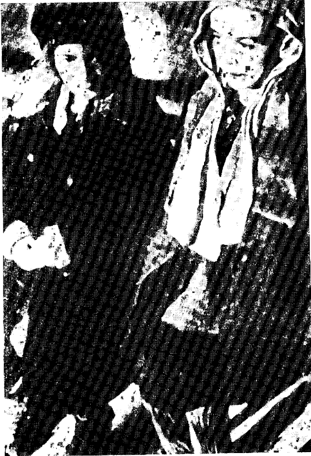
גבריים ממזדונים לבנות הגטו העניות והדלות מתוך הספר הנפלא "עולמות של טוהר" ח"א עמוד 53

איזו כף מהן תכריע??? (הסיפור מורסם ב"המודיע" לפני כחמשים שנה, בעת המאבק נגד שרות לאומי)