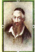
רבינו משה אלשיך זיע"א בעל מחבר ספר "דמ"א" נפטר בעיר קראית י"ז י"ח אייר שנת ת"א שנת ה'תש"ג (שם אביו ר' ישראל ז"ל)