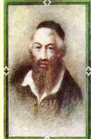
רבינו משה איסרליש זיע"א בעל מחבר ספר "דרכי משה" נפטר בעיר קראקא י"ד ירח אייר שנת ת"ר (ה'ת"ק) לפ"ק (שם אביו ר' ישראל ז"ל)