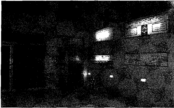
הכניסה לבנין המועצה הדתית פתח תקוה

הרבנות הראשית לפ"ת מגיבה בתדהמה ובודקת את הסיפור החמור